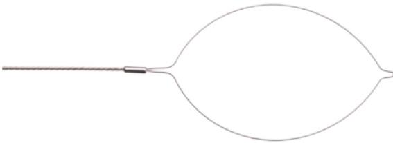
S - L(D)Ø - a x b sym